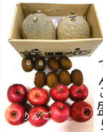
フルーツ てんこ盛り