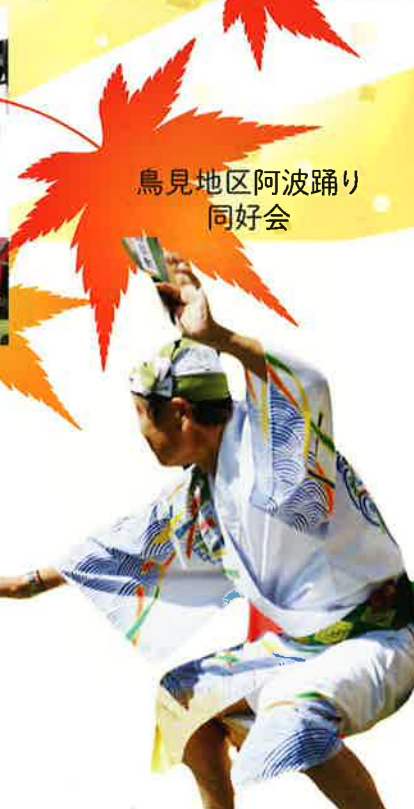
鳥見地区阿波踊り同好会

秋晴れの中、『秋のつどいinきららの木』を無事開催することができました。今年の『つどい』は暑い夏を避け、秋の開催としました。汗ばむほどの陽気の中、約650の方が参加くださいました。ありがとうございます。また、出演店いただいた方々にはご協力いただき、心より感謝申し上げます。来年もまたみなさんと楽しめることを願っております。今後ともよろしくお願いたします。