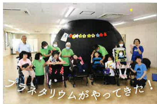
プラネタリウムがやってきた!