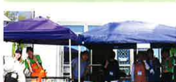
学生ボランティア