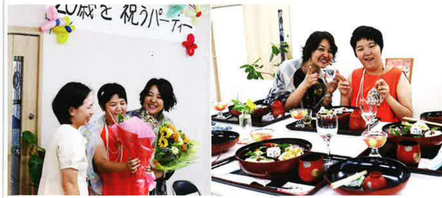
お祝いを祝うパーティー