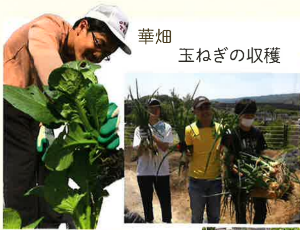
華畑 玉ねぎの収穫