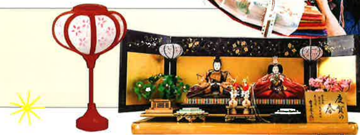
みんなで星をみたよ!