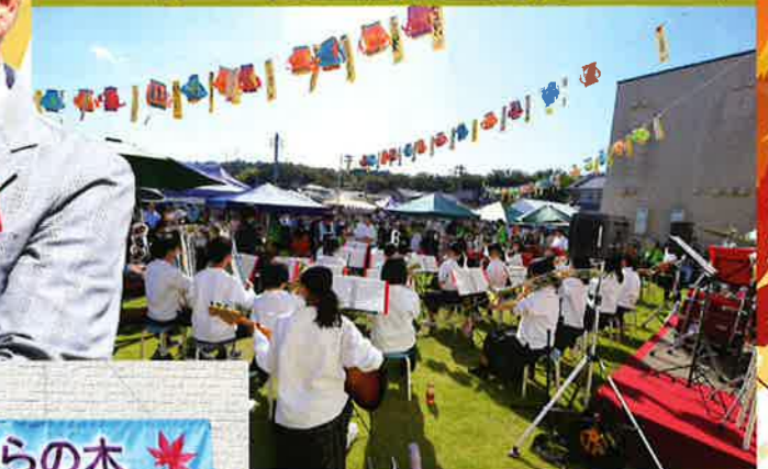
富雄中学校吹奏楽部