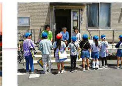
鳥見小学校「まちたんけん」 令和6年5月29日