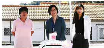
奈良市富雄西地域包括支援センター