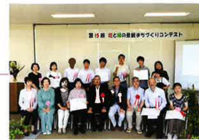
生駒市第15回花と緑の景観 まちづくりコンテスト 令和5年7月2日