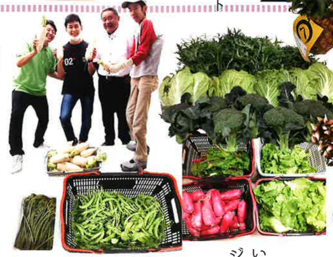
わらび&スナップエンドウ