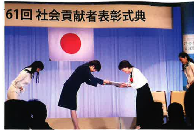
受賞者功績紹介・表彰状の贈呈