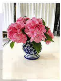
季節のお花で 彩りを添えていただきました。