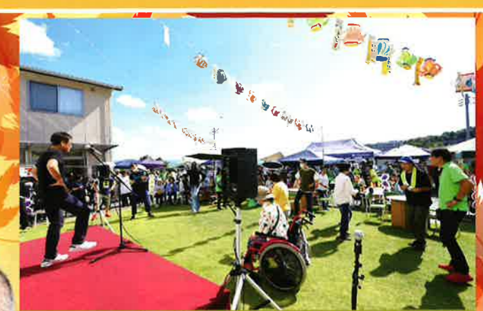
転ばぬ先の体操 (鳥見ふらっと)