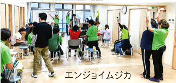
エンジョイムジカ