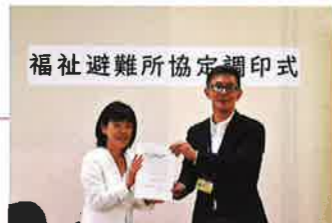
福祉避難所協定調印式 令和5年5月10日

奈良市との協定により、きららの木が福祉避難所として指定されました。これにより、災害時に一次避難所では過ごしにくい障がいのある方が安心して避難できる場所が確保されました。今後も、きららの木では地域の方が安心して集まれるような催しや支援活動を積極的に行っていく予定です。