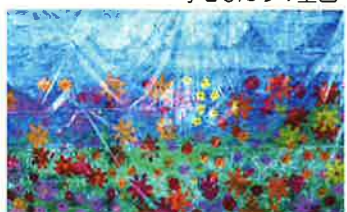
放課後等デイサービス 子どもたちの壁画