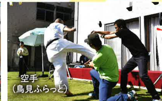
空手 (鳥見ふらっと)