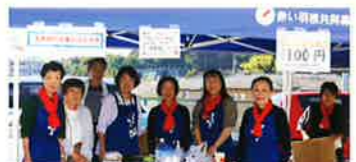
鳥見地区社会福祉協議会