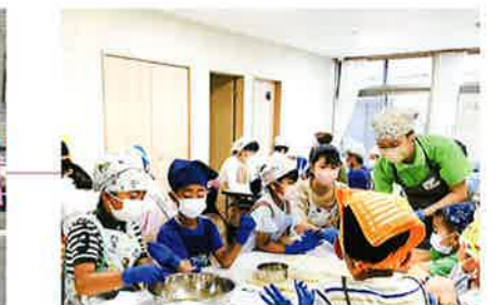
リレー講座(プリンづくり) 令和6年6月9日