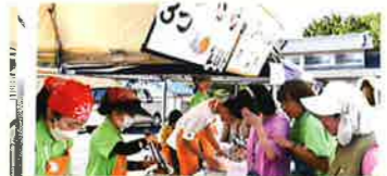
認定NPO法人きららの木利用者・職員チーム