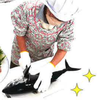
巧みな包丁さばき