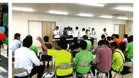
富雄中学校ボランティア部 交流会 令和6年10月4日