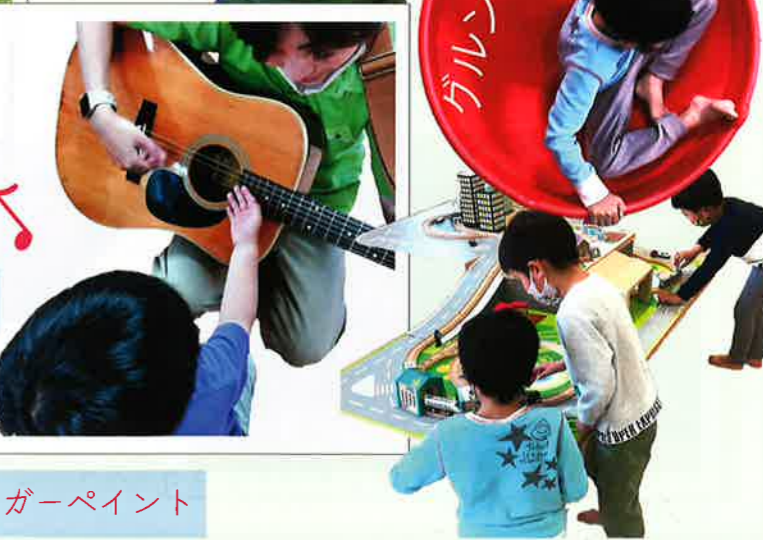
フィンガーペイント