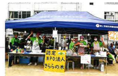
三碓夏祭り 会場:奈良市立富雄中学校 令和6年8月3日