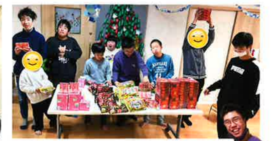
明治ホールディングス株式会社 株主のみなさま