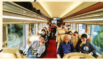
日帰り旅行 いろいろ