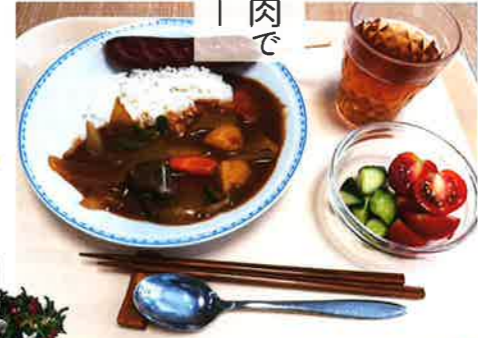
いただいたお肉で ジビエ夏カレー