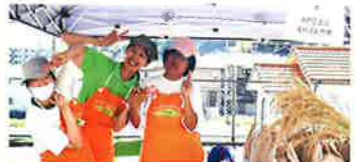
NPO法人くれよんの里