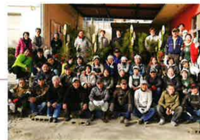
門松づくり (鳥見地区共同開催) 令和5年12月23日