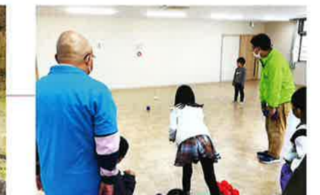
鳥見放課後子ども教室 「ポッチャ大会」 令和5年11月26日