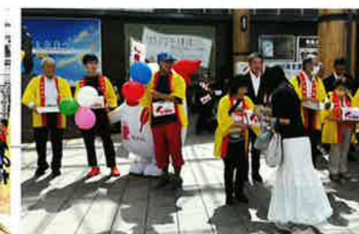
令和6年赤い羽根共同募金運動 オープニングセレモニー 令和6年10月1日