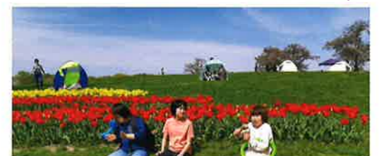
馬見チューリップフェア

短期入所 ◆ きららの木 ショートステイ月華 ◆ きららの木 ショートステイ月夢