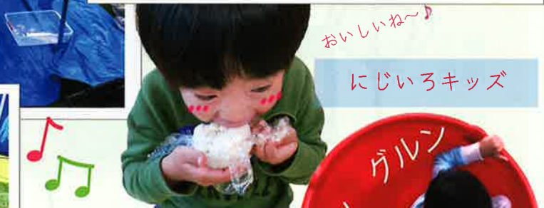
おいしいね〜♪ にじいろキッズ