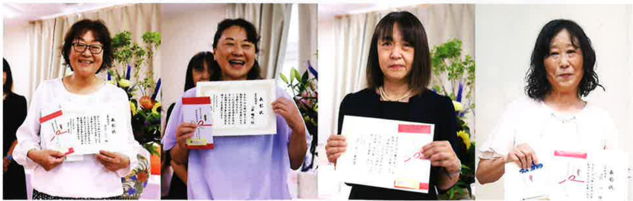
永年勤続者 (勤続10年以上)