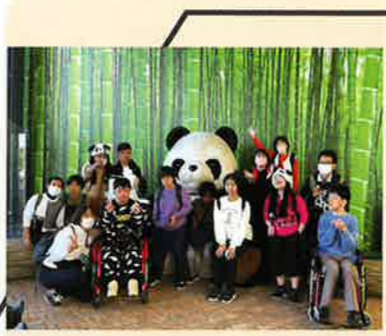
アドベンチャーワールド