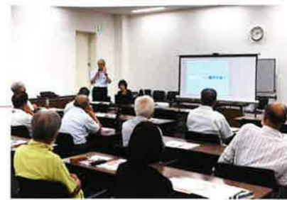
まほろばあいサポーター研修 通年