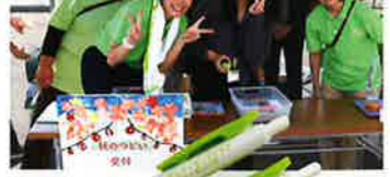
奈良セントラルライオンズクラブ