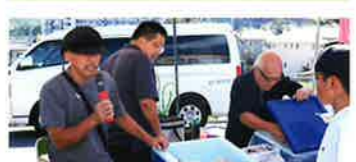
コミュニティワークコソから