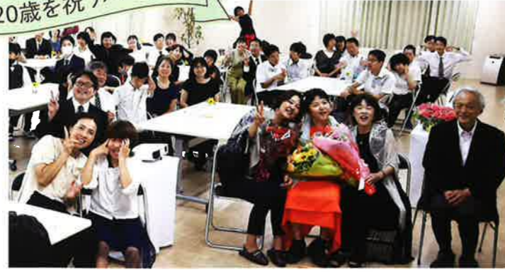
20歳を祝うパーティー