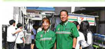
セブンイレブン移動販売車