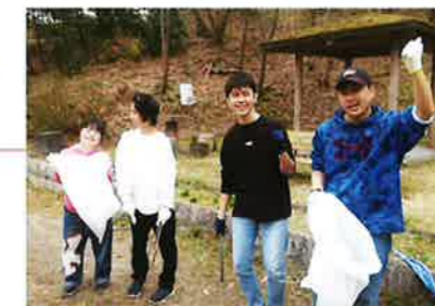
鳥見クリーン大作戦 令和5年11月23日