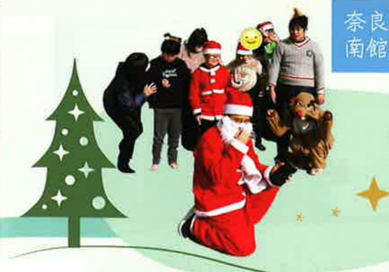
奈良町資料館の 南館長サンタがやってきた