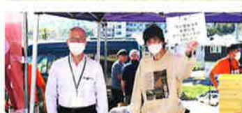
社会福祉法人青葉に会