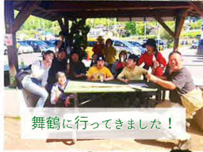
舞鶴に行ってきました!