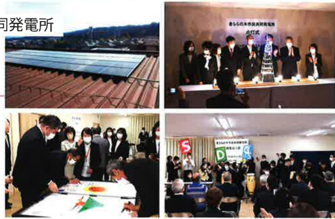
きららの木市民共同発電所 完成を祝う会 令和5年3月11日

令和4年度奈良市市民共同発電所補助事業を活用し「きららの木市民共同発電所」(NPO法人「サークルおてんとさん」と共同で設置)が完成しました。太陽光発電システムはSDGsとカーボンニュートラルを目指すことと併せて、災害時の非常事態が起きたときの電源になります。