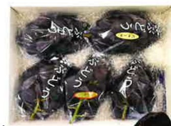
シャインマスカット