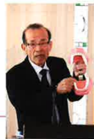
正田歯科医院 前院長 正田先生による研修会 令和6年1月16日