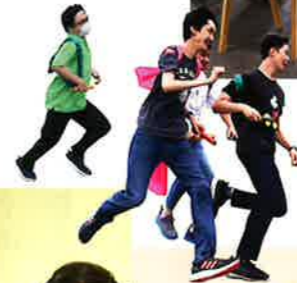
アートギャラリー 2024