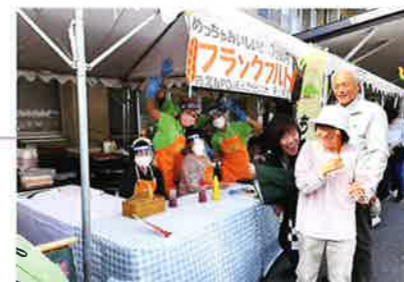
いこいごまつり 会場:社会福祉法人いこま福祉会かざぐるま 令和5年11月4日