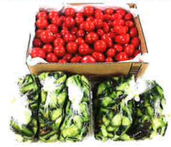
ミニトマトと きゅうりの浅漬け