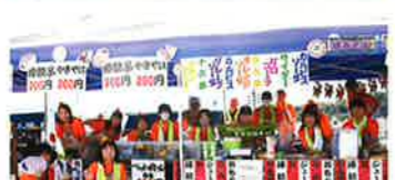
チームきららの木きららの木生活介護保護者