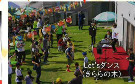
Let'sダンス (きららの木)