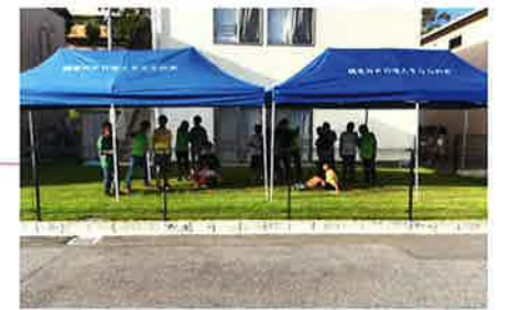
赤い羽根共同募金 令和4年度募金(令和5年度実施)奈良県共同募金助成 すべての子どものこころとからだはぐくみ遊具・備品購入助成 令和5年9月27日