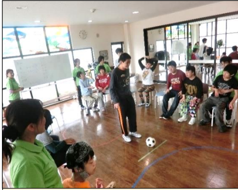
作業室・多目的室