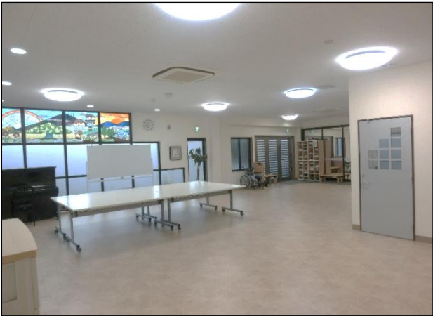
作業室・多目的室